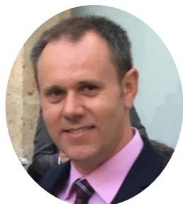
David Hervás Canal Isabel II

El manual tiene como objetivo proporcionar una sencilla y práctica guía para una correcta explotación y mantenimiento de los depósitos de abastecimiento de agua a poblaciones, pero también para trabajos menos habituales y complejos ante los que cualquier empresa explotadora puede encontrarse, recurriendo a ejemplos prácticos a los que hemos tenido que enfrentarnos.